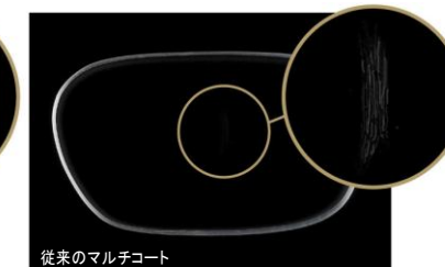
従来のマルチコート