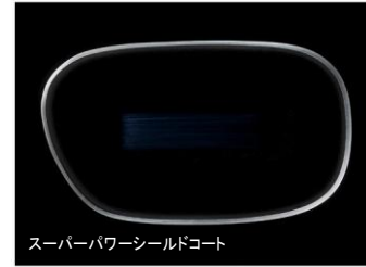
スーパーパワーシールドコート