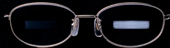
スーパーパワーシールドコート (摩擦試験: 当社比) 従来のマルチコート