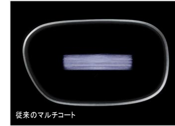
従来のマルチコート