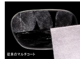
従来のマルチコート