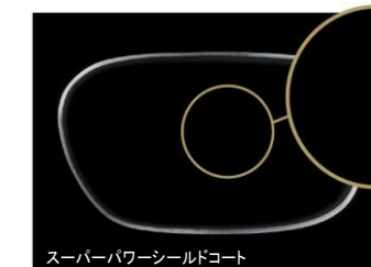
スーパーパワーシールドコート