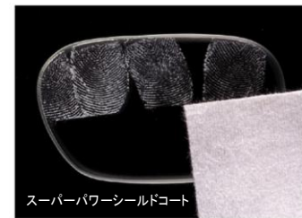
スーパーパワーシールドコート